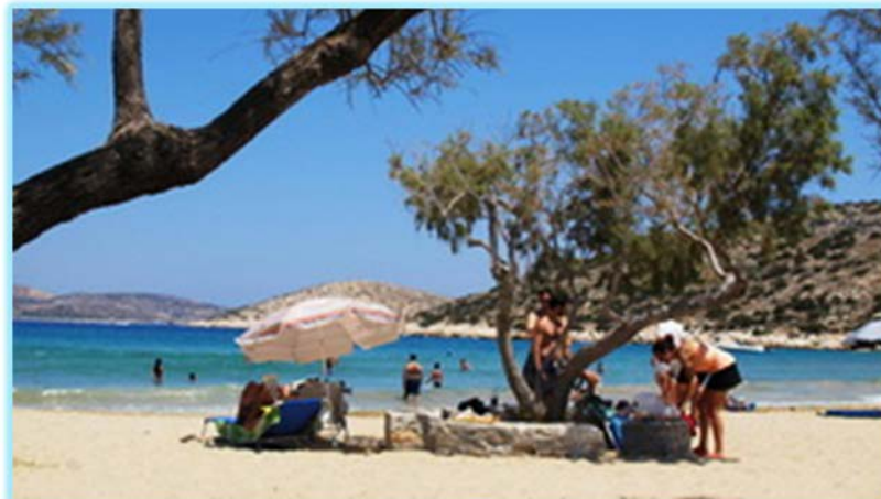
Mehrjährige Tamarisken in Livadi