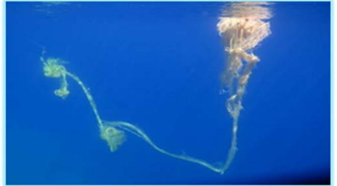
langes Treibnetz(!!!), am Fels verfangen