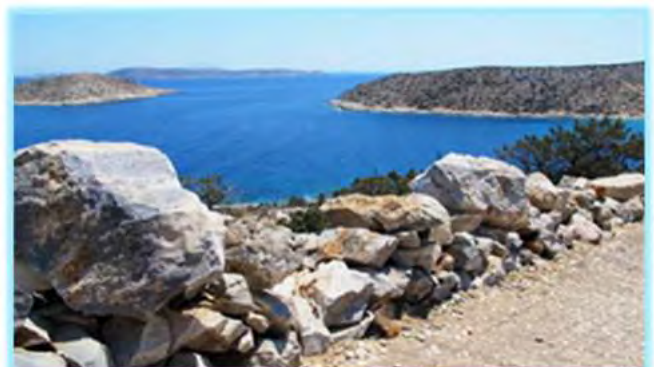
...und hier gibt's noch was zu tun...