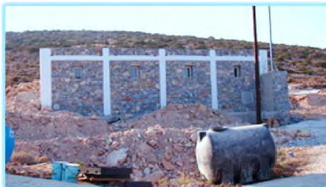
Die neue – hier noch als Baustelle...