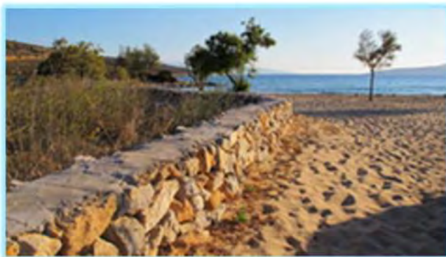
Neu befestigte Mauer in Livadi (von 2017)